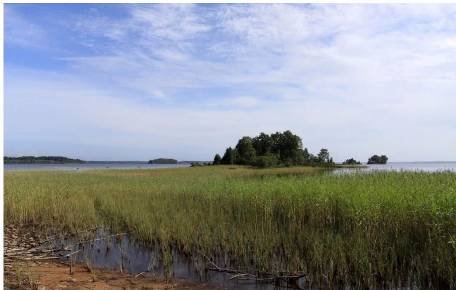
Inre Jättabron 10 augusti 2014

Från parkeringsplatsen går man österut och med hjälp av intuitionen upptäcker man en mycket liten stig in bland tallar och blåbärsris. Vid strandkanten efter ett par hundra meters promenad, möter man ett vassbälte och nu är det sjöns vattennivå och fotbeklädningen som avgör fortsättningen. Vid högvatten utan höga stövlar är det stopp (om man inte låter fötterna få en stunds blötläggning i sensommarvärmen). Vid lågvatten är det bara att fortsätta ut till den första holmen, Inre Jättabron, och sedan allt längre ut, kanske ända till Yttre Jättabron.