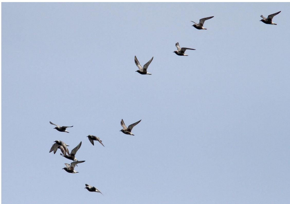
Kustpipare, Jättabron 10 augusti 2014.

Fåglar finns att se året runt men sensommaren är kanske allra mest spännande. Bolmen leder sträckande fåglar som är på väg mot västerhavet ner mot sjöns sydvästra del. Vid mitt hittills enda besök fick jag uppleva sträckande kustpipare och myrspovar. På de grunda stränderna rastade mosnäppa, strandskata och gluttsnäppor. I omgivningarna fanns lärkfalk, stor- och smålom, nötkråka, mindre korsnäbb och rödstjärt.